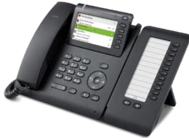
OpenScape Desk Phone CP600 / CP600E