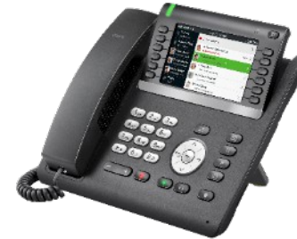
OpenScape Desk Phone CP700X