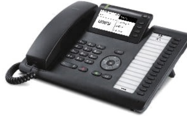
OpenScape Desk Phone CP400T