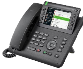
OpenScape Desk Phone CP700