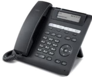
OpenScape Desk Phone CP200 / CP205 / CP200T