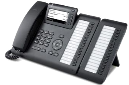
OpenScape Desk Phone CP400