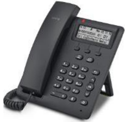
OpenScape Desk Phone CP100