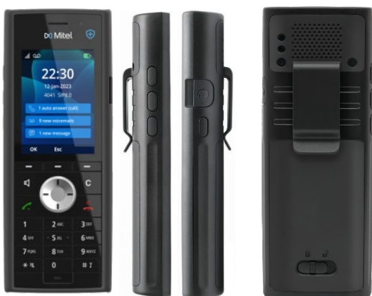
*Mitel 722dt DECT-Mobilteil

Die Funktions- und Firmware-Updates halten die Mobilteile Over-the-Air auf dem neuesten Stand. Die neue 700d DECT-Serie arbeitet mit den bestehenden 600d DECT-Mobilteilen und Mitel SIP DECT-Basisstationen zusammen, da sie die gleichen RFPs haben. Nutzen Sie Ihre bestehenden Investitionen in die Mitel-Infrastruktur – Sie müssen sie nicht ständig ersetzen.